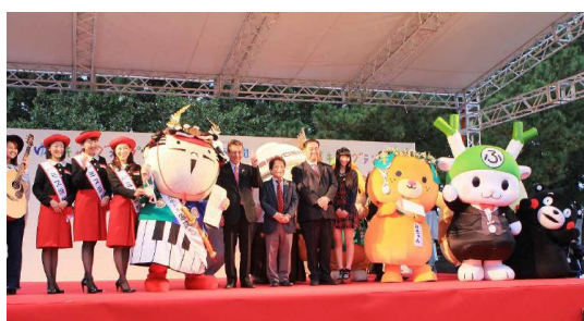
ゆるキャラグランプリ

東京と大阪の二大都市のほぼ中間地点。JR東海道線弁天島駅から徒歩で約10分。 東名高速道路舘山寺スマートI.Cから車で約20分、浜松西I.Cから車で約25分。