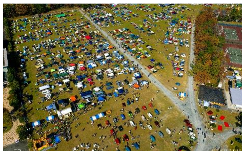
ジャパンミニディin浜名湖