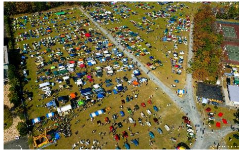
ジャパンミニディin浜名湖