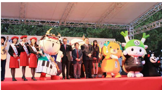
ゆるキャラグランプリ

東京と大阪の二大都市のほぼ中間地点。JR東海道線弁天島駅から徒歩で約10分。東名高速道路館山寺スマートI.Cから車で約20分、浜松西I.Cから車で約25分。