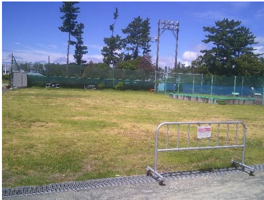
イベント広場 A 面