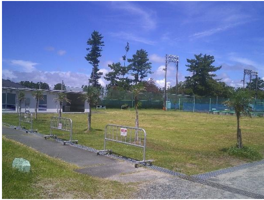
イベント広場全面