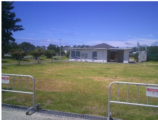
イベント広場 B 面