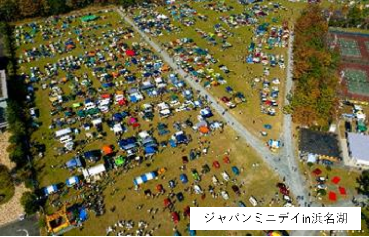
ジャパンミニデイin浜名湖

東京と大阪のほぼ中間地点。JR東海道線弁天島駅から徒歩10分。東名高速道路浜松西I.Cから車で25分。舘山寺スマートI.Cから車で20分。