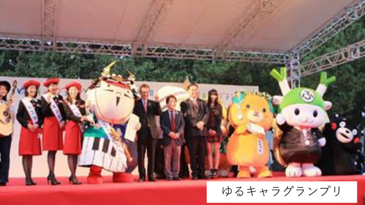
ゆるキャラグランプリ