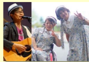
三畳一間 with BOGGY